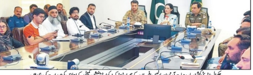
پولیس نے بتایا کہ لاہور سمیت صوبہ بھر کی 222 صوبیتی منڈیوں کی کمیٹیوں کی تشکیل کے لیے 4 ہزار سے زائد افسران و اہلکار تعینات کیے گئے ہیں۔

لاہور (این آئی) ایف ڈی کی کمیٹیوں کی تشکیل کے لیے پولیس کے افسران و اہلکار تعینات کیے گئے ہیں۔ پولیس نے بتایا کہ لاہور سمیت صوبہ بھر کی 222 صوبیتی منڈیوں کی کمیٹیوں کی تشکیل کے لیے 4 ہزار سے زائد افسران و اہلکار تعینات کیے گئے ہیں۔ پولیس نے بتایا کہ لاہور سمیت صوبہ بھر کی 222 صوبیتی منڈیوں کی کمیٹیوں کی تشکیل کے لیے 4 ہزار سے زائد افسران و اہلکار تعینات کیے گئے ہیں۔