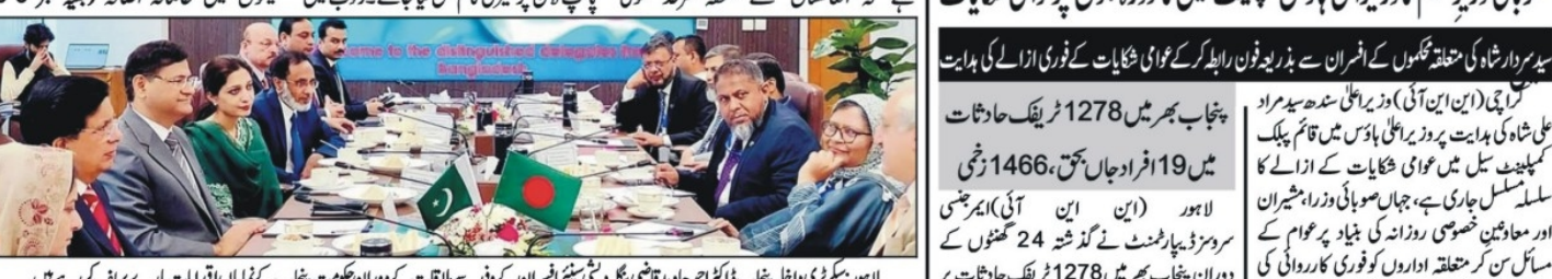
بانگلہ دیش، صدر شیو ڈیک فارما سیٹنگ گروپ میٹنگ میں وزیر اعظم شہباز شریف سے ملاقات کی۔

دووں ممالک کے درمیان اربوں ڈالر کی مفاہمت کی یادداشتوں کو معاہدوں میں تبدیل کرنا وقت کی ضرورت ہے۔ گجرات، گوجرانوالہ، لاہور، اسلام آباد، خیبر پختونخوا کا صدر جماعت منسوق روزنامہ اخبار