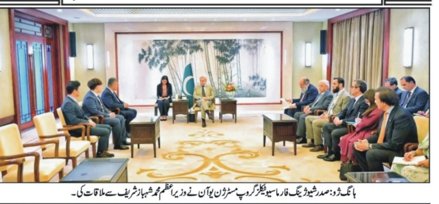
بانگلہ دیش، صدر شیو ڈیک فارما سیٹنگ گروپ میٹنگ میں وزیر اعظم شہباز شریف سے ملاقات کی۔