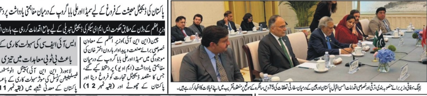
بانگلہ دیش، صدر شیو ڈیک فارما سیٹنگ گروپ میٹنگ میں وزیر اعظم شہباز شریف سے ملاقات کی۔

دووں ممالک کے درمیان اربوں ڈالر کی مفاہمت کی یادداشتوں کو معاہدوں میں تبدیل کرنا وقت کی ضرورت ہے۔ گجرات، گوجرانوالہ، لاہور، اسلام آباد، خیبر پختونخوا کا صدر جماعت منسوق روزنامہ اخبار